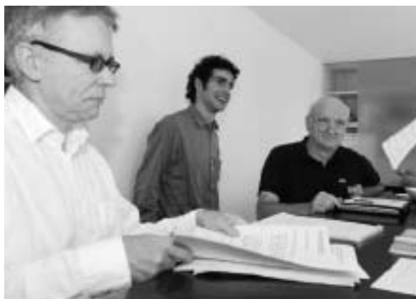
Bilder Seiten 40 – 42: Eindrücke vom «arbeitsmarkt»- Assessment. Interviewsituation (ganz links), Verteilen des Wissenstests (links), Gruppen- diskussionen (unten links und rechts). Immer dabei: die Assessoren.